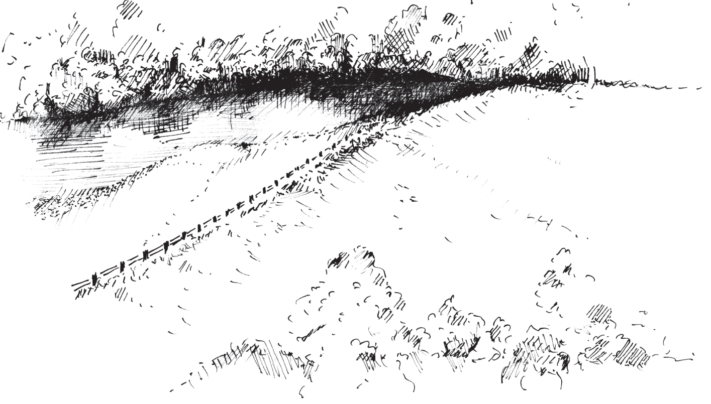
Die Isar etwa im Jahr 1900. Der einengende Uferverbau ließ keine natürliche Seitenerosion zu.

Gleichzeitig bietet sich ein spannender Einblick in natürliche Prozesse der Natur. Denn bereits bei kleinen Hochwassern entstehen neue Uferabbrüche und die Flusslandschaft verändert sich. Bei fortschreitender Entwicklung müssen Radfahrer und Spaziergänger manchmal an kritischen Stellen vorbeigeleitet werden und können erst im späteren Verlauf wieder an die Ufer zurückkehren. Ein kleiner, abwechslungsreicher Umweg, der dem Fluss die große Chance gibt, ein Stück seines ursprünglichen Charakters und seiner Natürlichkeit zurück zu erlangen.