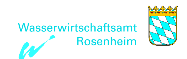
Flusswasserkörper 1_F573 "Isen von Außerbittlbach bis Mündung" Umsetzungskonzept