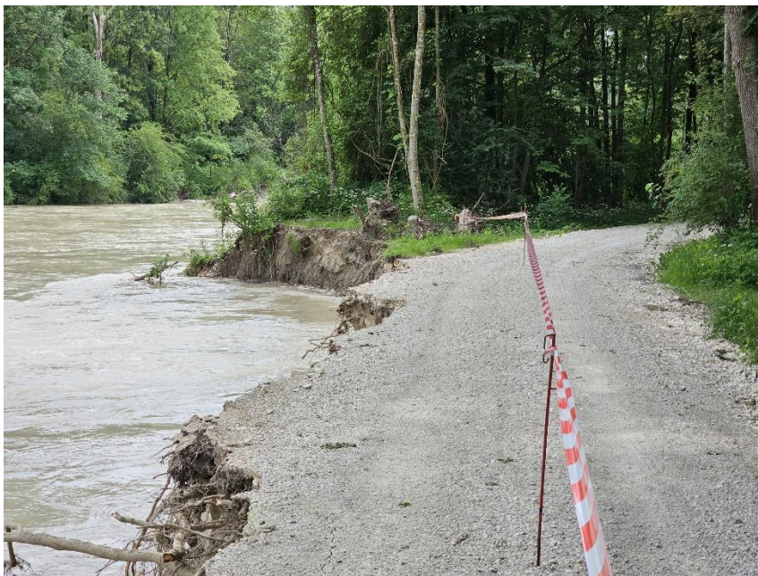
Beschädigter Isarradweg auf Höhe Flusskilometer 117

Wir bitten alle Nutzer des Weges um Verständnis und auch im eigenen Interesse, die Absperrung nicht zu ignorieren und die Umgehungsstrecke zu nutzen.