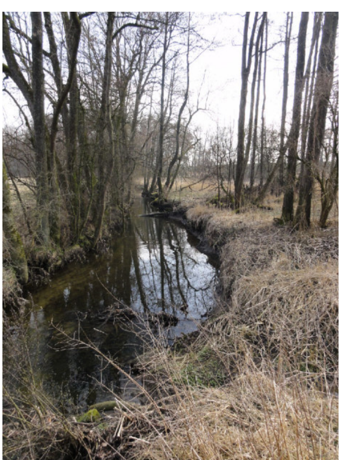
Strogen bei Fikm 30,72